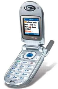
Téléphone LG3200 Écran couleur 99.99$ (reconditionner)